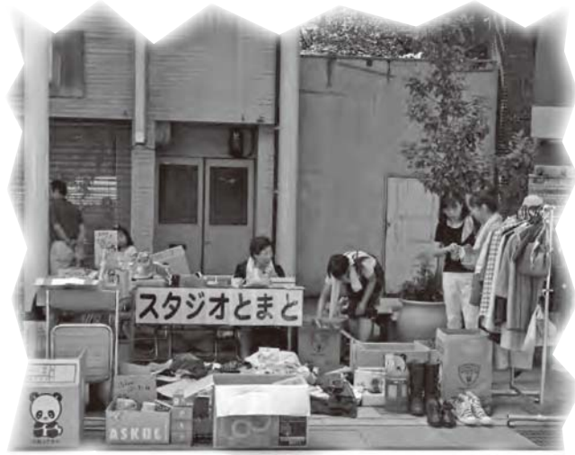
フリーマーケットの様子

フリーマーケットの物品を提供してくださった方、売上にご協力くださった方、ありがとうございました。