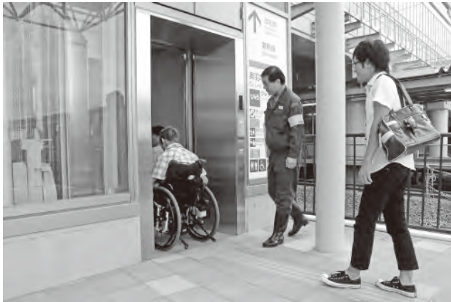
エレベーターは車いす2台入りました。

今回は複数の福祉団体に対して12月の新幹線本格開業前に、施設内のバリアフリー設備を披露することを主な目的としていて、こんな早い時期に駅の中を見られるという、ちょっとした優越感を感じながら見学してきました。