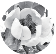
ウケザキオオヤマレンゲ